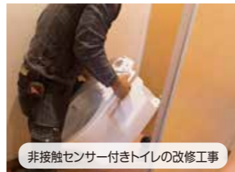
非接触センサー付きトイレの改修工事