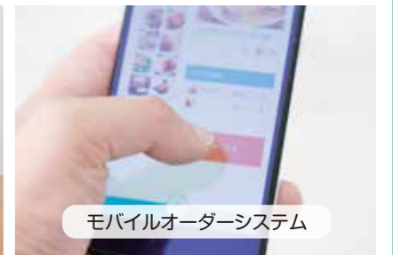
モバイルオーダーシステム