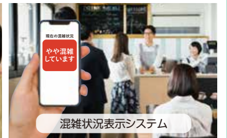
混雑状況表示システム