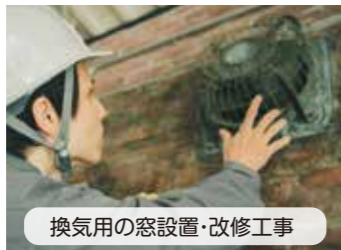
換気用の窓設置・改修工事