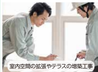
室内空間の拡張やテラスの増築工事