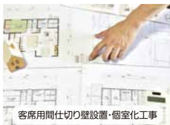
客席用間仕切り壁設置・個室化工事