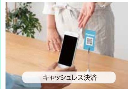
キャッシュレス決済