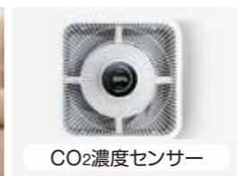
CO 2 濃度センサー