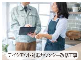
テイクアウト対応カウンター改修工事

※単なる店舗のリフォームなど感染症対策を目的としない工事は対象外です。 ※既存設備等の単なる更新にかかる工事は対象外です。 ※申請者自身で設置する場合など、設置工事を含まない場合は物品導入経費として取り扱います。