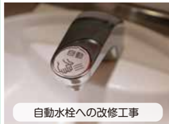
自動水栓への改修工事