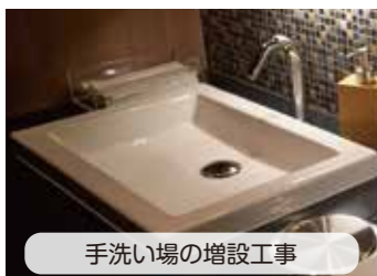
手洗い場の増設工事