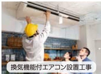
換気機能付エアコン設置工事